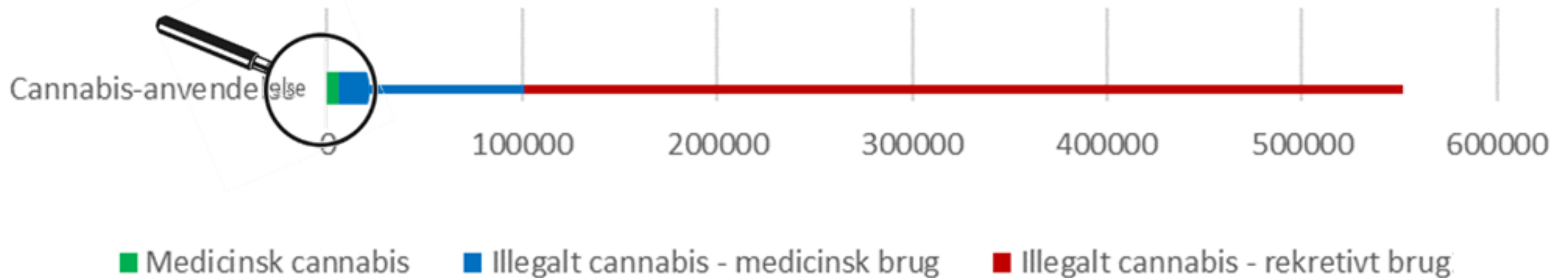
Figur 1 Ifølge tal fra Sundhedsstyrelsen, 11% af de 16-44-årige har prøvet cannabis indenfor det seneste år. E-sundhed.dk, dst.dk