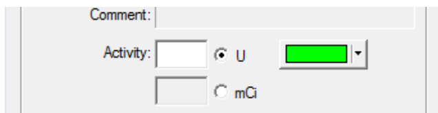
Fig. 1 Indtastningsfelt for kildeaktivitet

VariSeed kræver, at brugeren angiver aktiviteten for den kilde, som implanteres i patienten. Aktiviteten kan angives i U eller mCi.