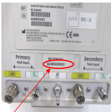
Selvstændigt Giraffe-genoplivningssystem Serienummerets placering