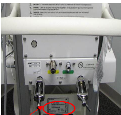
Integreret Giraffe-/Panda-varmergenoplivningssystem med blender Serienummerets placering