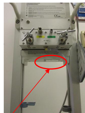
Integreret fritstående Panda-varmergenoplivningssystem Serienummerets placering