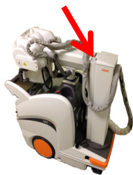
Ingen afstand ved bom

Her er det område på enheden, hvor eventuel løshed af bommen let kan ses;