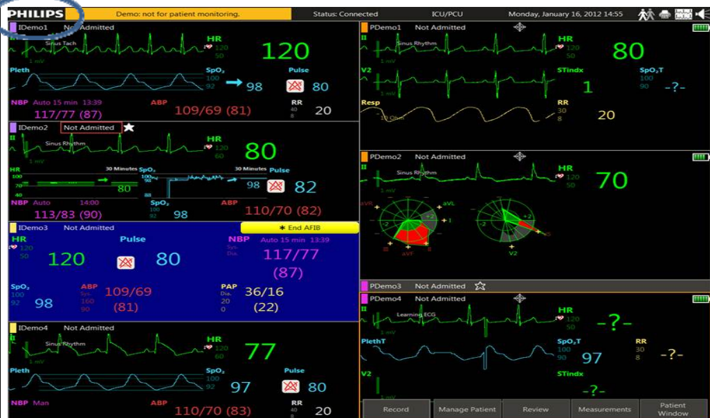
Figur 1 - Placering af Philips-vandmærket

PIIC iX version A.XX - Identificer det berørte produkt ved at klikke på Philips-vandmærket på PIIC iX-overvågningsskærbilledet. Se figur 1. Dette vil fremkalde produktsupportsiden. Softwareversionen har den release, som produktet kører. Se figur 2.