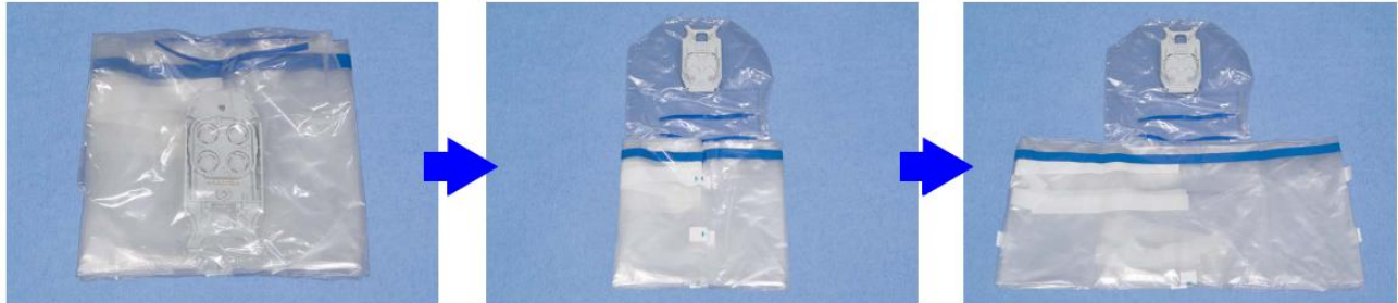
Figur 1. – Eksempel: Afdækning til instrumentarmen