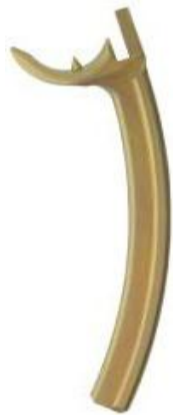
Caudal Rib Supports, Left, 70 mm radius