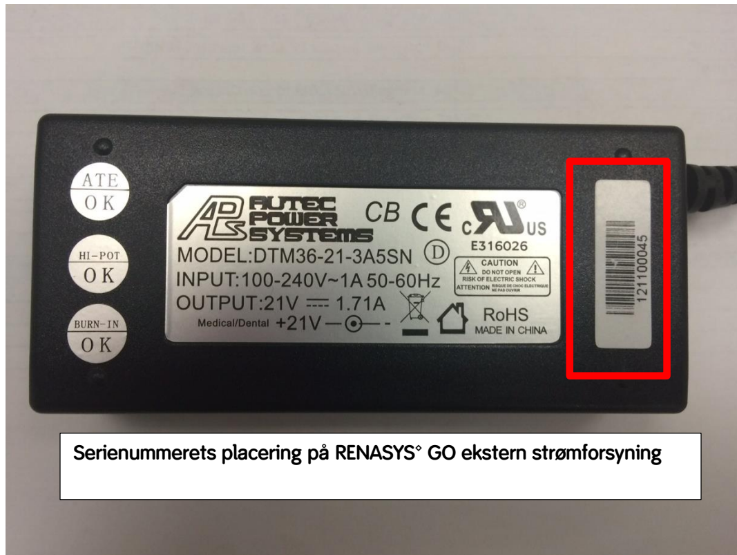
Figur 2 – Serienummerets placering på den eksterne strømforsyning.