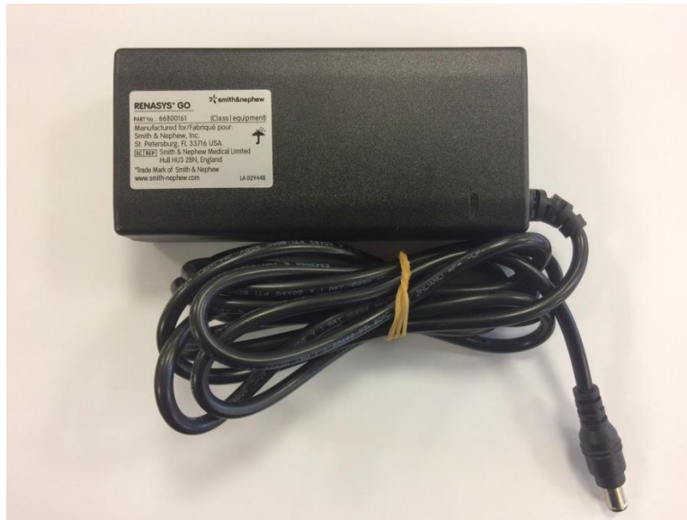
Figur 1 – De berørte eksterne strømforsyninger

Formålet med denne produktinformation er at give vores kunder og distributører oplysninger, så de kan identificere de berørte eksterne strømforsyninger, samt at informere om de nødvendige handlinger, kunder og distributører skal udføre.