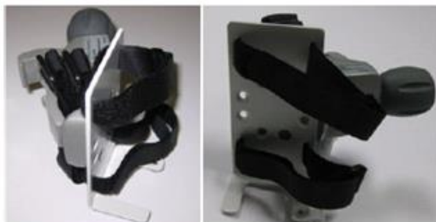
Figur 15-8 EV1000-strømadapterbeslag

Figur af indstilling af strømforsyning fra brugermanualen til EV1000A (Figur 15-8 og 15-9)