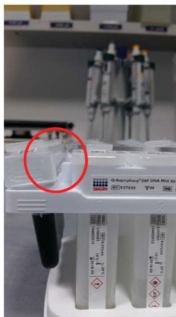
Forkert placeret/skævstillet kuglerende