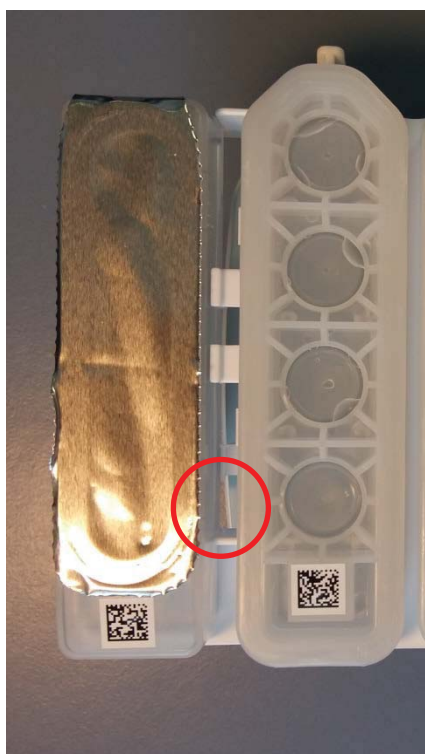
Forkert holder til reagensbeholder