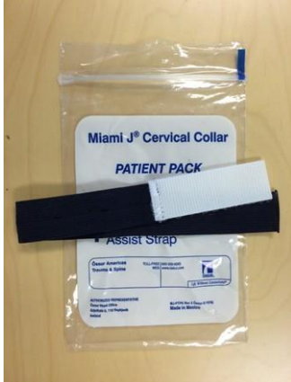
Miami J® Cervical Collars Assist Strap