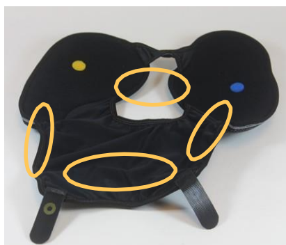
Rebound® Cartilage Wraparound