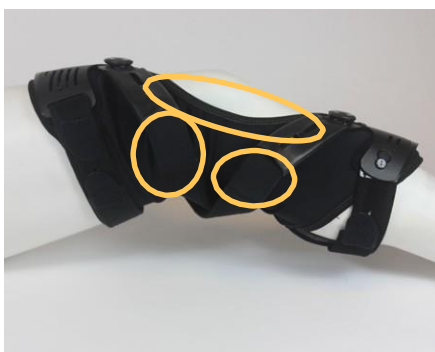
Rebound® Cartilage Wraparound