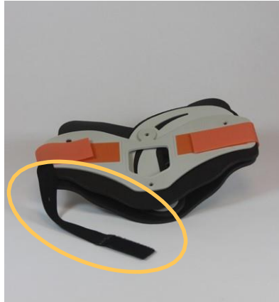
Necloc® Extrication Collars Attached Assist Strap