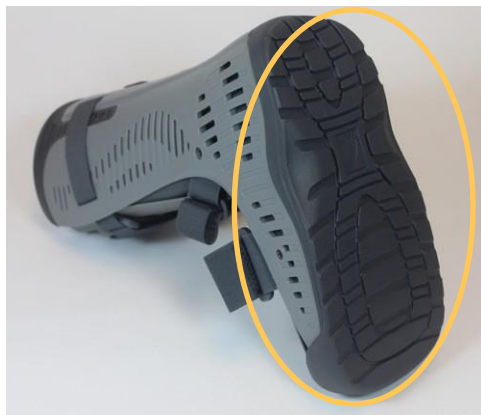
Rebound® Air Walker