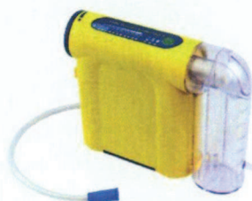
LCSU 4 300 ml (3,3 lbs) beholderversion

Vigtig meddelelse! Denne vigtige sikkerhedsmeddelelse gælder kun for Laerdal Compact Suction Units 4 (LCSU 4) fremstillet siden 1. maj 2015.