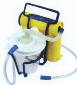
LCSU 4 800 ml (4,3 lbs) beholderversion