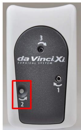
Figur 1: Stapler instrumentudløsningshul 2 "lukket" med et hvidt flag til stede

I situationer, hvor udløsningshul 2 er dækket med et hvidt flag (Figur 1) og ikke er tilgængeligt, skal SRK drejes i udløsningshullerne 1, 2 og 3.