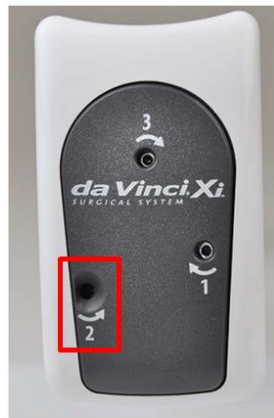
Figur 2: Stapler instrumentudløsningshul 2 "åbent" uden hvidt flag

For at undgå at værktøjet går i stykker, skal brugere følge anvisningerne til manuel hæfterudløsning, der findes i Tillæg til Brugervejledning til EndoWrist Stapler instrumenter og tilbehør: