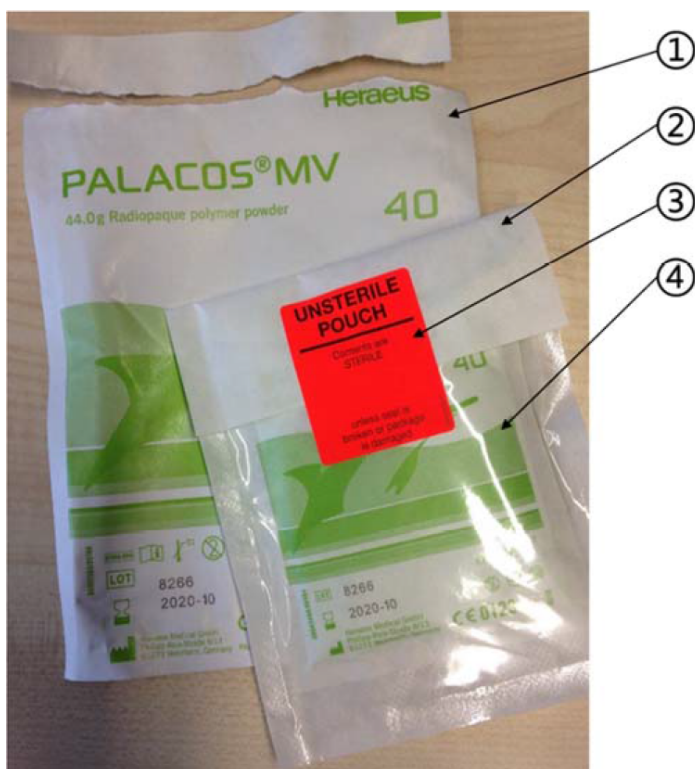
Billede: Beskrivelse af produkt del