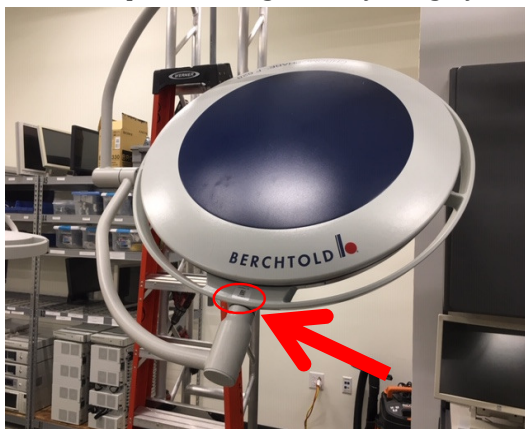
Figur 1: F 528/F 628 lyshoved med påsat berørt dæksel på lyshoved

Formålet med denne meddelelse er at informere dig om, at Stryker Communications frivilligt korrigerer de ovenfor berørte F 528/F 628-dæksler på lyshoveder, som er en del af Strykers Berchtold Chromophare kirurgiske belysningsystem.