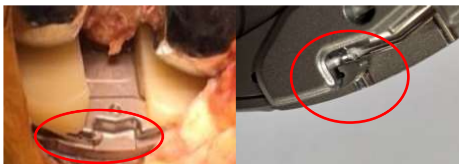
I fuldt indgreb