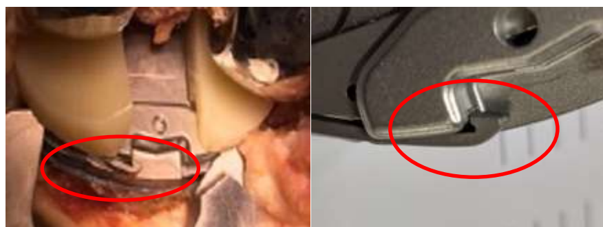
Ikke i fuldt indgreb