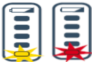
Figur 2: Batteriopladningsdisplay