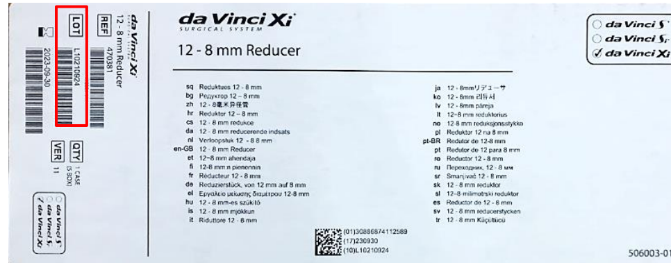
Figur 2: Eksempel på placering af partinummet på forsendelseskassen

For at hjælpe dig med at identificere partiet viser nedenstående billede, hvor du kan finde partinummet på mærkatet på indpakningen til da Vinci Xi og X 12-8 mm reducerende trokarindsats (etiket på forsendelseskassen og den indvendige indpakning).