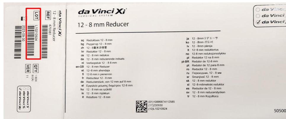
Figur 3: Eksempel på placeringen af partinummeret på etiketten på den indvendige indpakning