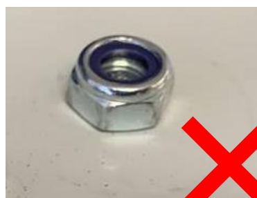
Figur 3 – ikke gangbar