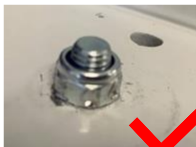
Figur 2 – gangbar

Hillrom har modtaget en klage efter det blev opdaget, at traverslæde var blevet leveret med forkerte skruer, der ikke er gangbare. I henhold til specifikationerne skal skruernes længde være M8X25 (25 mm), men skruerne i den berørte produktionsserie var M8X20 (20 mm). M8X20 låser ikke mod nyloc-møtrikken, når den installeres i henhold til installationsvejledningen, som vist i figur 2 (korrekt skrue) og figur 3 (forkert skrue) nedenfor.