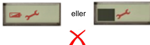
Figur 3 Apparat ikke driftsklart