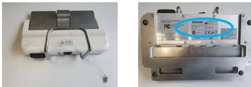
Figur 1: Placering af mærkat i bunden af fodkontakten