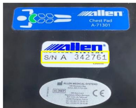
Figur. 2. Etiket med serienummer