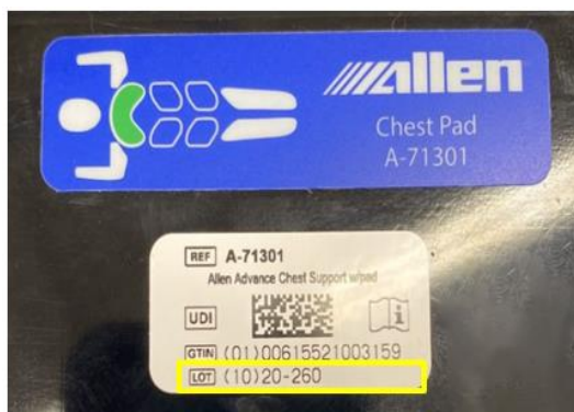
Figur. 1. Lotnummeretiket