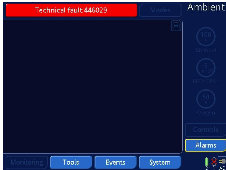
Figur 1: Displayet viser "Ambient state" og en rød meddelelse med en teknisk fejlnummer (eksempel, et andet teknisk fejlnummer kan blive vist)

Under "Ambient State" vil respiratoren alarmere hørbart og visuelt og vise følgende på skærmen: