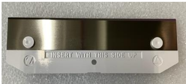
Figur 1 Dermatome Blade

Berørt produkt: Zimmer® Dermatome Blades (se listen over berørte produkter Bilag 2 )