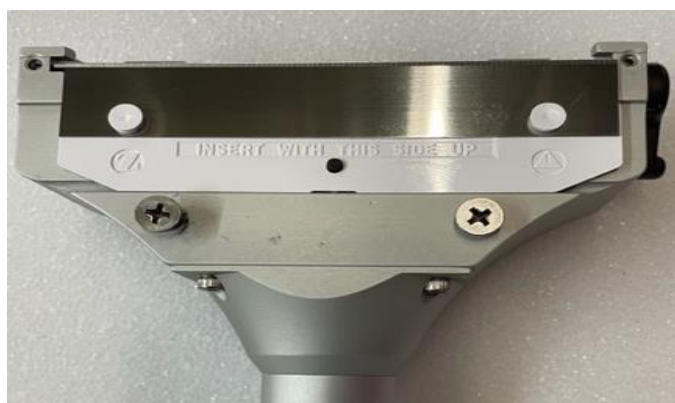
Figur 2 Dermatome Blade samlede i Dermatome Handpiece

Zimmer Surgical, Inc. udfører i øjeblikket en batch-/lot-specifik sikkerhedsrelateret handling for Zimmer® Dermatome Blades som anført i Bilag 2 – Liste over berørte produkter . Vi har modtaget 38 klager over hudtransplantater, der var for tynde, ikke-ensartede, når de berørte blade blev anvendt til hudtransplantater. Problemet opdages først under brugen, og dette kan medføre, at der er behov for yderligere vævshøst for at kunne dække området tilstrækkeligt. Det er lægens ansvar at opveje fordelene ved at have en ufuldstændig dækning i forhold til at have yderligere transplantater, på grundlag transplantatets tilstand, den samlede patienttilstand samt i hvilken grad, der er behov for transplantatet.