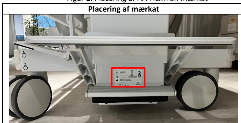
Figur 2. Placering af HA FlexTrak-mærkat

HA FlexTrak-identifikationsmærkatens er placeret på trolleyens håndtagsside under pumpepedalen, som vist i figur 2.