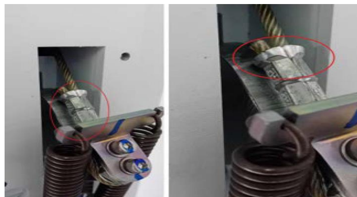
Figur 1. Crimpet klemme på stålkabel

Philips har ikke modtaget nogen rapporter om dette problem eller om nogen personskade pr. april 2024.