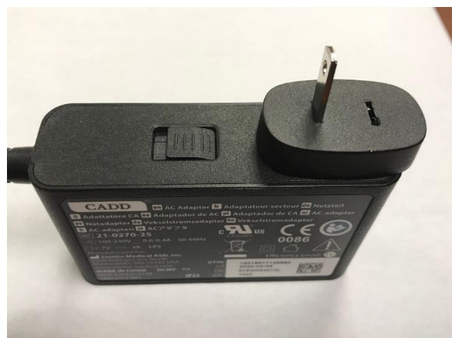
Figure 3: AC-adapter med manglende AC-stik