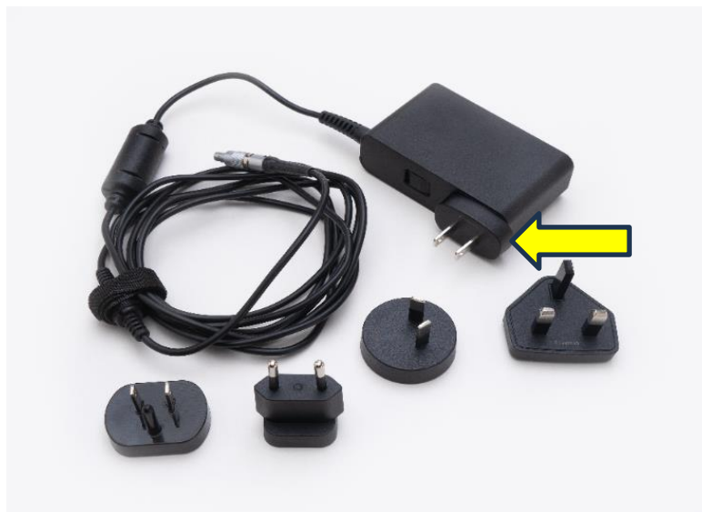
Figure 1: CADD-Solis AC-adapters

AC-adapterens indgangsstik, fremhævet i figur 1 nedenfor, kan blive beskadiget eller gået i stykker. Hvis indgangsstikket er beskadiget, kan metalkontakterne til vekselstrømsadapterens krop være blotlagt, eller en eller flere af vekselstrømsstikket kan skilles fra indgangsstikket.