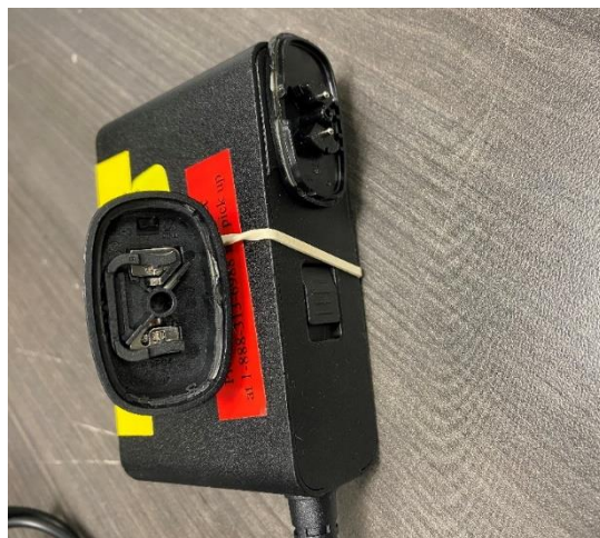
Figure 2: Beskadiget indgangsstik