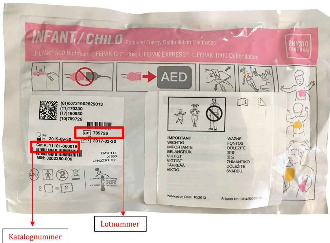
Figur 1 – Placering af katalognummer og lotnummer