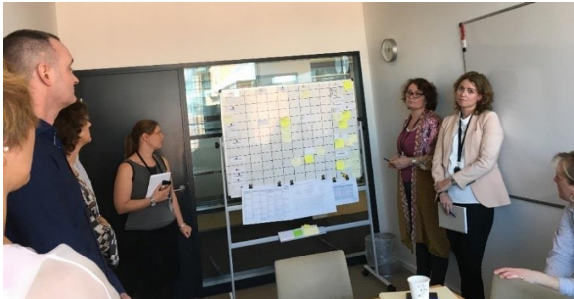
Forberedelse af sprint i LEOPARD-projektet om et nye lægemiddelregister

Agil gennemførelse af projekter ligger på mange måder i direkte forlængelse af lean. Og spørgsmålet, hvorfor vi skal arbejde agilt, må i høj grad besvares ved, at det for det første er nødvendigt, når projekterne er så komplekse og skal gennemføres i så dynamiske omgivelser, så en egentlig kravspecifikation up front er en illusion. Erfaringerne fra IT-projekterne vil i høj grad kunne anvendes inden for faglige projekter, såsom implementering af ny lovgivning. Den agile tilgang skal derfor også kobles ind i vores generelle oplæg for uddannelse af projektledere.