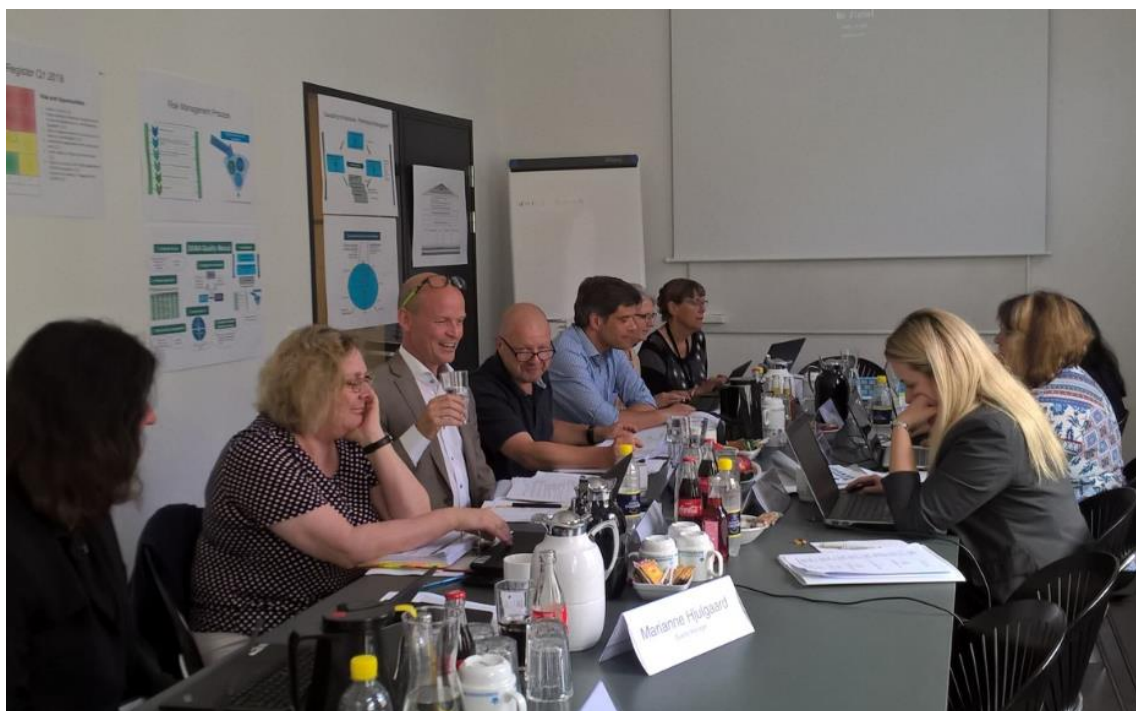
God energi under BEMA-assessment hvor vi opnåede en samlet score på 4,5 på femtrinsskala

Alle delstrategier såvel som hovedstrategien reviews årligt ud fra høstede erfaringer og vurderinger af ændringer i omverdenen mv.